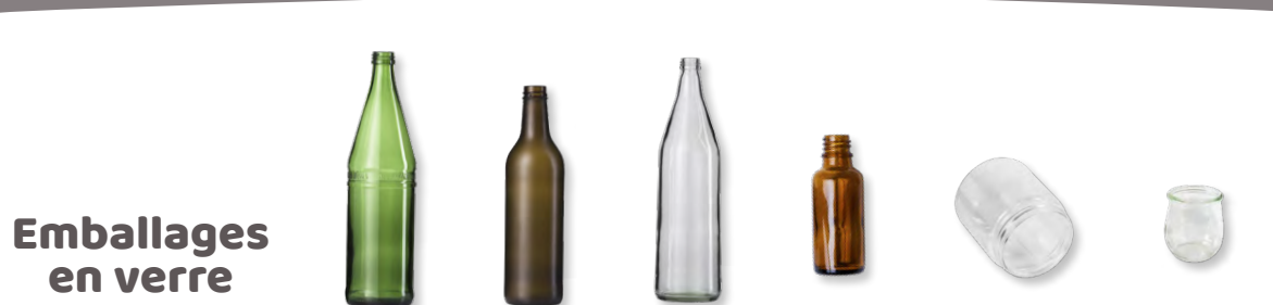
Emballages en verre