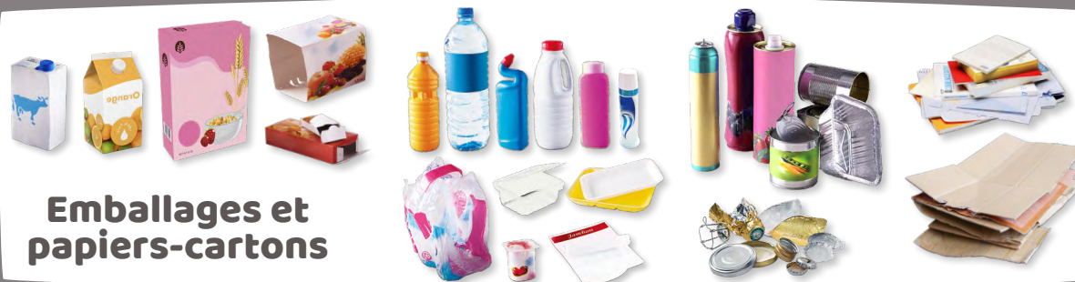
Emballages et papiers-cartons